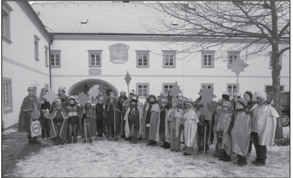
Foto oben: Am 5. Jänner waren 35 Kinder aus der Pfarre Gars gemeinsam mit zehn BegleiterInnen unterwegs. Als Dankeschön für ihr Engagement wurden die Kinder eine Woche später von der Diözese St. Pölten ins Horner Stadtkino zu einem Danke-Kino eingeladen.