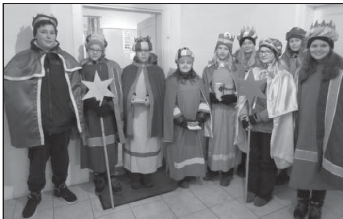
Foto oben: In der Pfarrgemeinde St. Leonhard waren drei Sternsingergruppen am 4. Jänner unterwegs. Heuer kamen die Spenden dem Land Tansania zugute, wo sie für Wasserprojekte verwendet werden.

Foto oben: Am 5. Jänner waren 35 Kinder aus der Pfarre Gars gemeinsam mit zehn BegleiterInnen unterwegs. Als Dankeschön für ihr Engagement wurden die Kinder eine Woche später von der Diözese St. Pölten ins Horner Stadtkino zu einem Danke-Kino eingeladen.